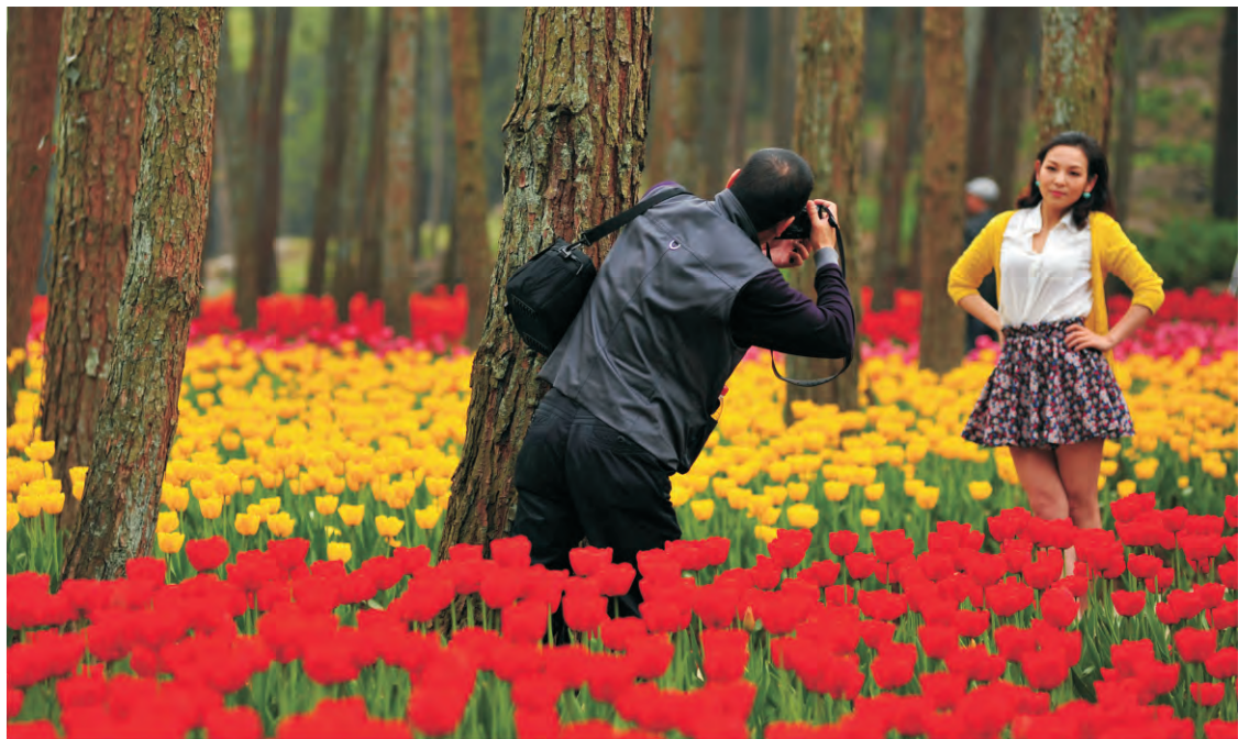
重庆大木花谷风景区