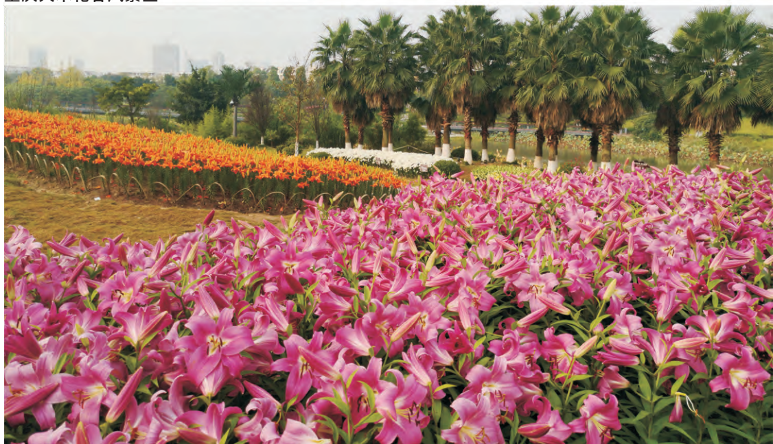
四川遂宁圣莲岛风景区