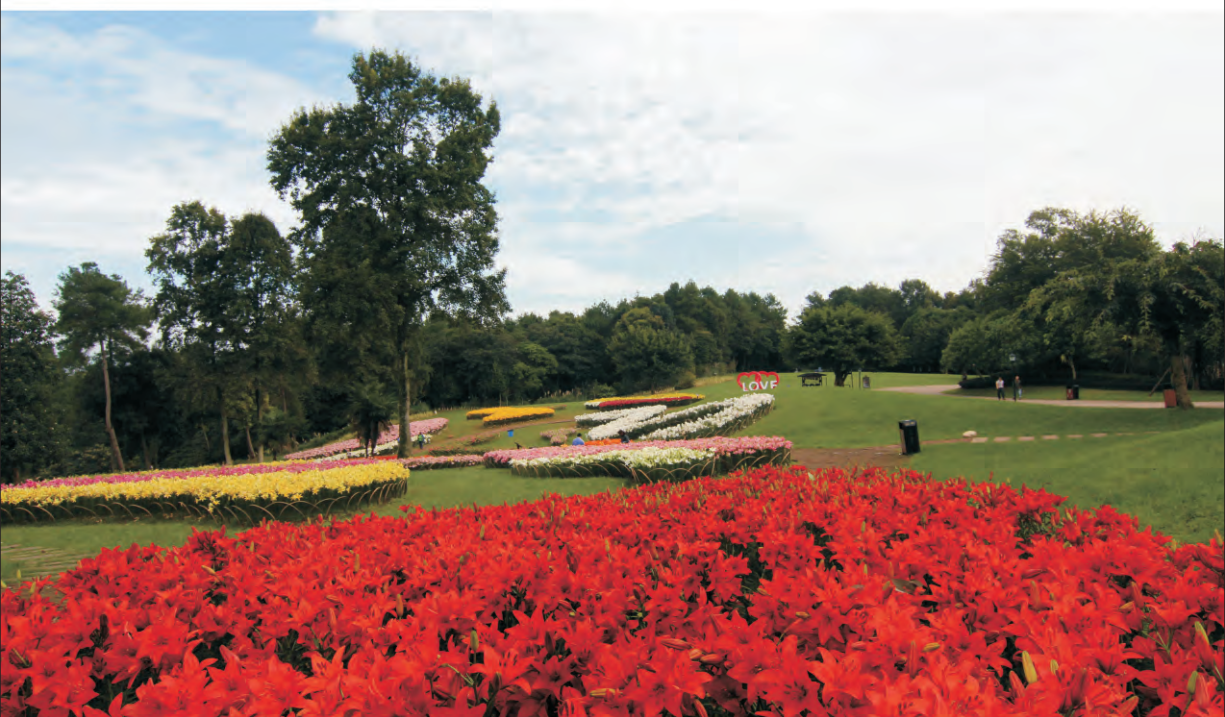
成都石象湖风景区·国庆百合花展