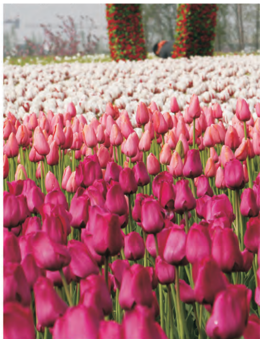
常州花谷奇缘景区