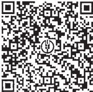
浙江丽彩园艺有限公司 (扫码支付：支付宝、微信均可)