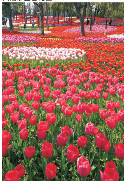
上海大宁灵石公园