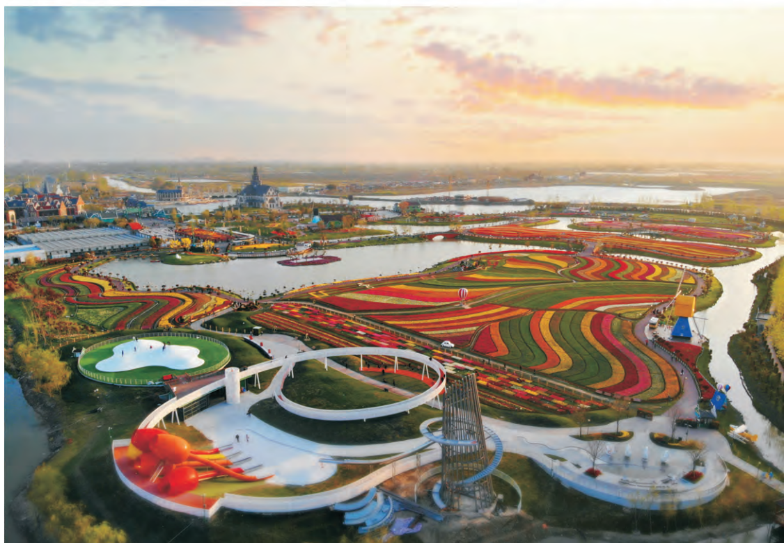
江苏大丰荷兰花海